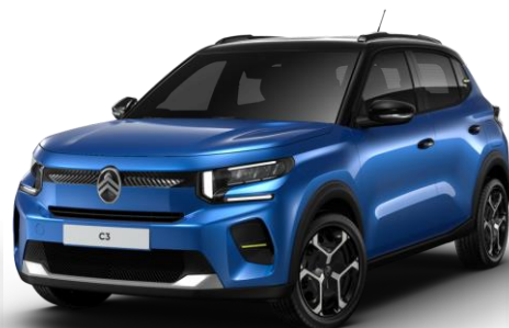
Bright Blue – toit Noir Perla Nera (O*) Color Clips Yellow Lemon