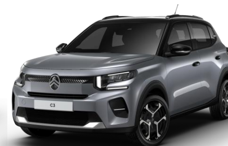
Gris Mercury – toit Noir Perla Nera (O*) Color Clips Blanc