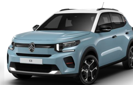
Bleu Monte Carlo – toit Blanc Opale (O*) Color Clips Infra Rouge