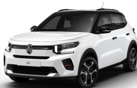
Blanc Banquise – toit Noir Perla Nera (O*) Color Clips Infra Rouge