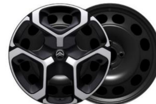
Enjolveurs 17" AZURITE

● Série ○ Option # Véhicule homologué en type N1 – non transformable en VP