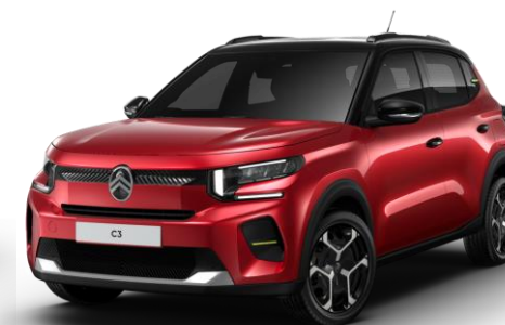
Rouge Elixir (1) – toit Noir Perla Nera (O*) Color Clips Yellow Lemon