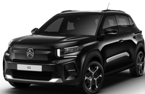
Noir Perla Nera – monoton (O) Color Clips Blanc