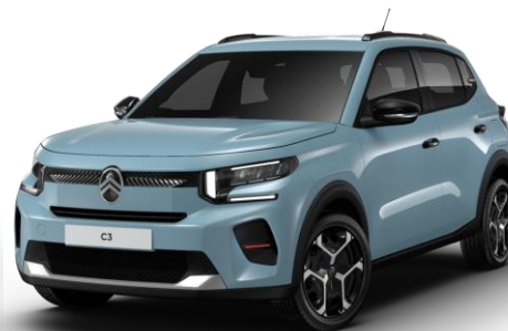
Bleu Monte Carlo – monoton (O) Color Clips Infra Rouge