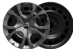
Enjolveurs 16" PYRITE