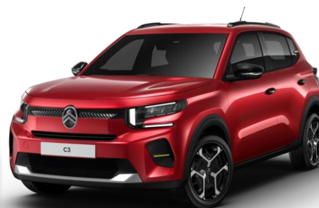
Rouge Elixir (1) – monoton (O) Color Clips Yellow Lemon